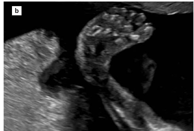
Şekil 1. Ultrasonografik muayenede fetal ayağın plantar düzlemde görüntülenmesi sırasında tibia ve fibulanın aynı planda izlendiği gri-skala ultrasonografi görüntüleri (a ve b).