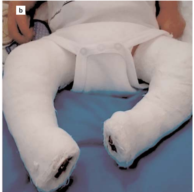
Şekil 2. Pes ekinovarus deformitesinde (a) konservatif tedavide Ponseti tekniğinde uygulanan düzeltici manipülasyonlar sonrasında uygulanan uzun bacak alçılama (b) görüntüsü.