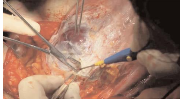
Şekil 3. Vezikanın uterusun anterior duvarından disseksiyonu elektrotroter, dik açılı klemp ve halka yardımıyla gerçekleştirilir.

İstatistiksel analizler, Statistical Package for the Social Sciences yazılımı sürüm 23 (IBM Inc., Armonk, NY, ABD) kullanılarak gerçekleştirildi. Dağılım türünü belirlemek için Shapiro-Wilk testi kullandı. Normal dağılıma sahip veriler ortalama \pm standart sapma, normal dağılıma sahip olmayan veriler ise medyan [25–75. persantil] ola-