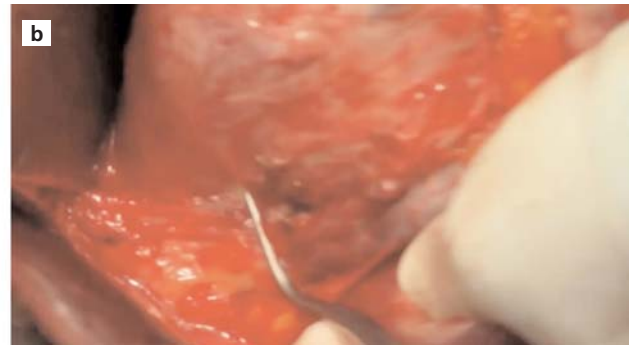
Şekil 2. (a) Bir Satinsky klempsi, sol infundibulopelvik ligament üzerine yerleştirilir. (b) Bir başka Satinsky klempsi, nazikçe sol uterin arter üzerine yerleştirilir.