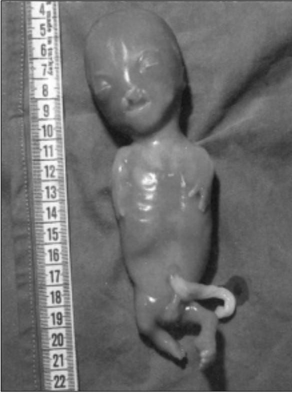
Resim 1. Postmortem muayenede yarık damak/dudak, tetra-fokomeli, belirgin penil gibi bulgular gözlenen fetusun önden görünümü.

Roberts-SC fokomeli sendromlu vakaların bir çoğunda karakteristik kromozomal bulgu olarak PCS bulgusu izlenmekle birlikte kromozomları normal olan bazı vakalar da bildirilmiştir. Bizim olgumuzda amniyotik sıvı kültüründen gerçekleştirilen fetal kromozom analizi sonucunda özellikle akrosentrik kromozomlarda PCS bulgusu gözlemlendi. Bu sendromun prenatal tanısında patolojik ultrasonografik ve sitogenetik bulgular çok önemlidir. Ancak bu tanının postnatal olarak da doğrulanması ailelere verilecek genetik danışma ve sonrasında izlenecek yol açısından önem taşımaktadır. Vakamızda yapılan postmortem muayene sonucunda fetusta ultrasonografik bulguların yanısıra belirgin gözler, hipertelorizm, glebellar hemanjiom, midfa-